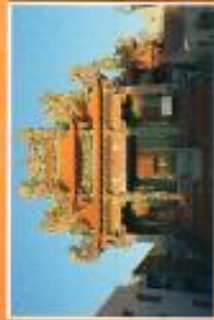
馬公市西衛里宸威殿

主神名字：玄天上帝 地址：澎湖縣馬公市西衛里 12 鄰 95 號 祭典日期：農曆三月三日