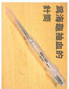
為海龜抽血的針筒