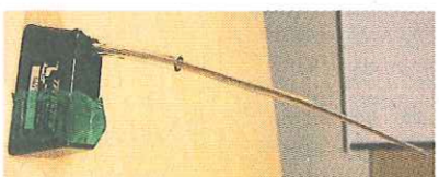
▶龜殼上安裝的衛星追蹤儀器 1 至 2 年後會自然脫落。

香港有 5 種受保護海龜，包括玳瑁、綠海龜、棱皮龜、欖蠟龜、赤蠟龜，其中綠海龜較常見。見到野生動物時，請盡量保持安靜，不要騷擾牠們，讓牠們自由安心地生活。如果看見海龜受傷，可致電「1823」熱線，聯絡 Connie 姐姐和其他「動物拯救員」！