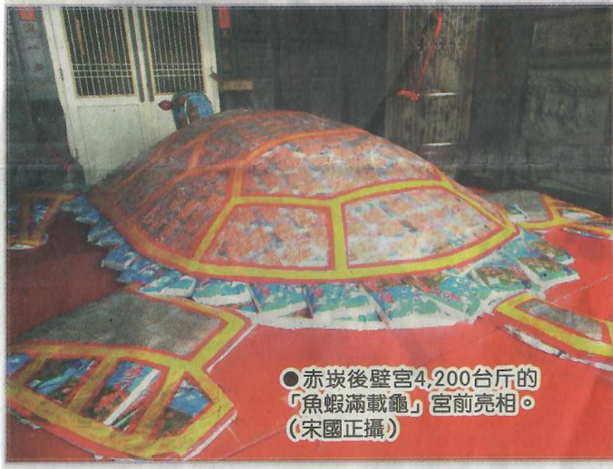
●赤崁後壁宮4,200台斤的「魚蝦滿載龜」宮前亮相。

今年後壁宮管理委員會為帶動元宵更多人潮，宮前除堆砌「魚蝦滿載龜」外，宮內亦推出現金2萬元、韓國首爾雙人來回機票、三洋5門式冷凍冰箱、32吋液晶電視、國際牌除濕機、三洋電暖器等6個獎項，供縣內信眾以擲筊方式拚輸贏。