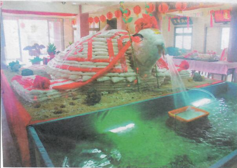
△馬公市興仁懋靈殿8800斤大米龜。

今年興仁懋靈殿，廟方除了製作了8800斤疊大米龜外，前方還製作大型養殖水池，另類活海鮮乞求活跳跳的龍蝦及帝王蟹，要讓信眾同樂，不但保平安，也能吃的滿足。