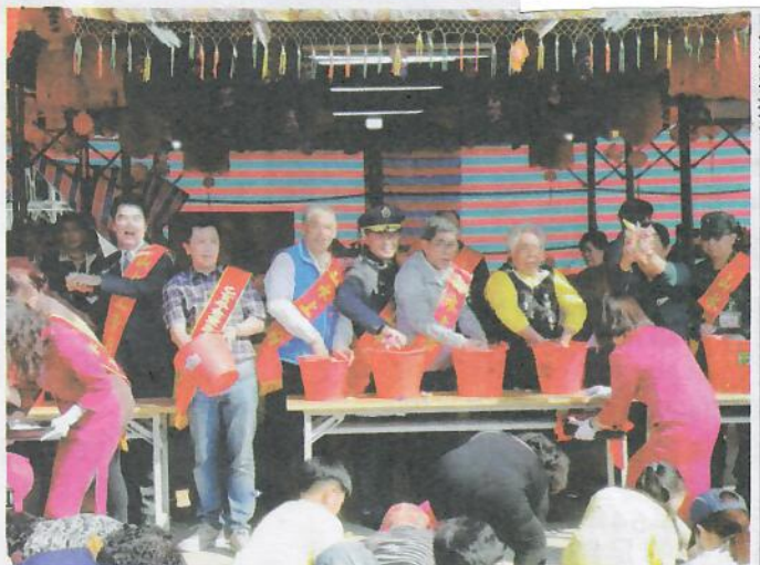
各界來賓為黃金龜點式儀式啟動。

【記者莊惠惠報導】元宵節是澎湖的大事，各廟宇各憑本事，發揮創意供民眾乞求。19日下午「黃金龜王」現身，由馬公鎖港北極殿的260兩奪冠；群龜力量，由山水上帝廟的372兩隻金靈龜拔得頭籌，市價都超過千萬元。 俗諺：「摸龜頭，起大樓；摸龜尾，存傢伙；摸龜殼，事業頭路穩達達；摸龜腳，金銀財寶滿厝腳」，昨日的點睛儀式吸引許許多多觀光客及民眾到場一睹走動式的房子，民眾趁著金龜王祭壇時，從頭到腳摸一遍，希望能沾沾喜氣。 還有對烏龜生態相當重視來自美國夏威夷的喬治·翰墨先生，十餘年來元宵節幾乎年兩、三年就來一趟，這次