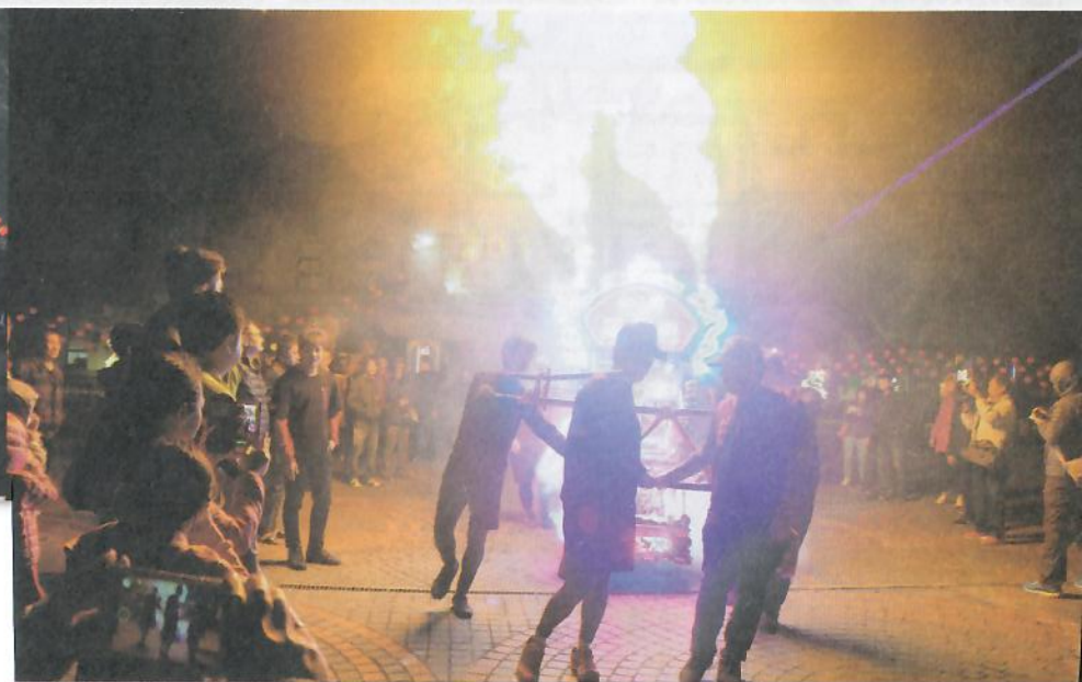
△「西巡慶元宵武轎踩街」活動為元宵熱場。