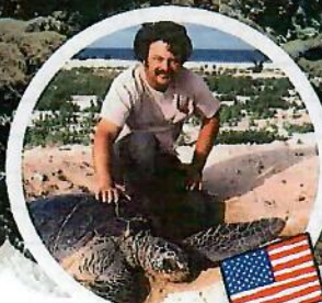
ジョージ・バラース 博士