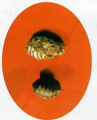
カメ類の祖先 (ユーノサウルス)

「ユーノサウルス」とは何でしょうか。南アメリカのペルム期(二畳期)の地層から発見される動物の化石が見られました。 ユーノサウルス入と各前を付けられたこの小さな動物の化石は、8枚の幅の広い肋骨があり、「カメ」の甲の発達につながります。 「カメ」の祖先ともいえるものとの考えられています。「カメ」の祖先ともいえるものなので。