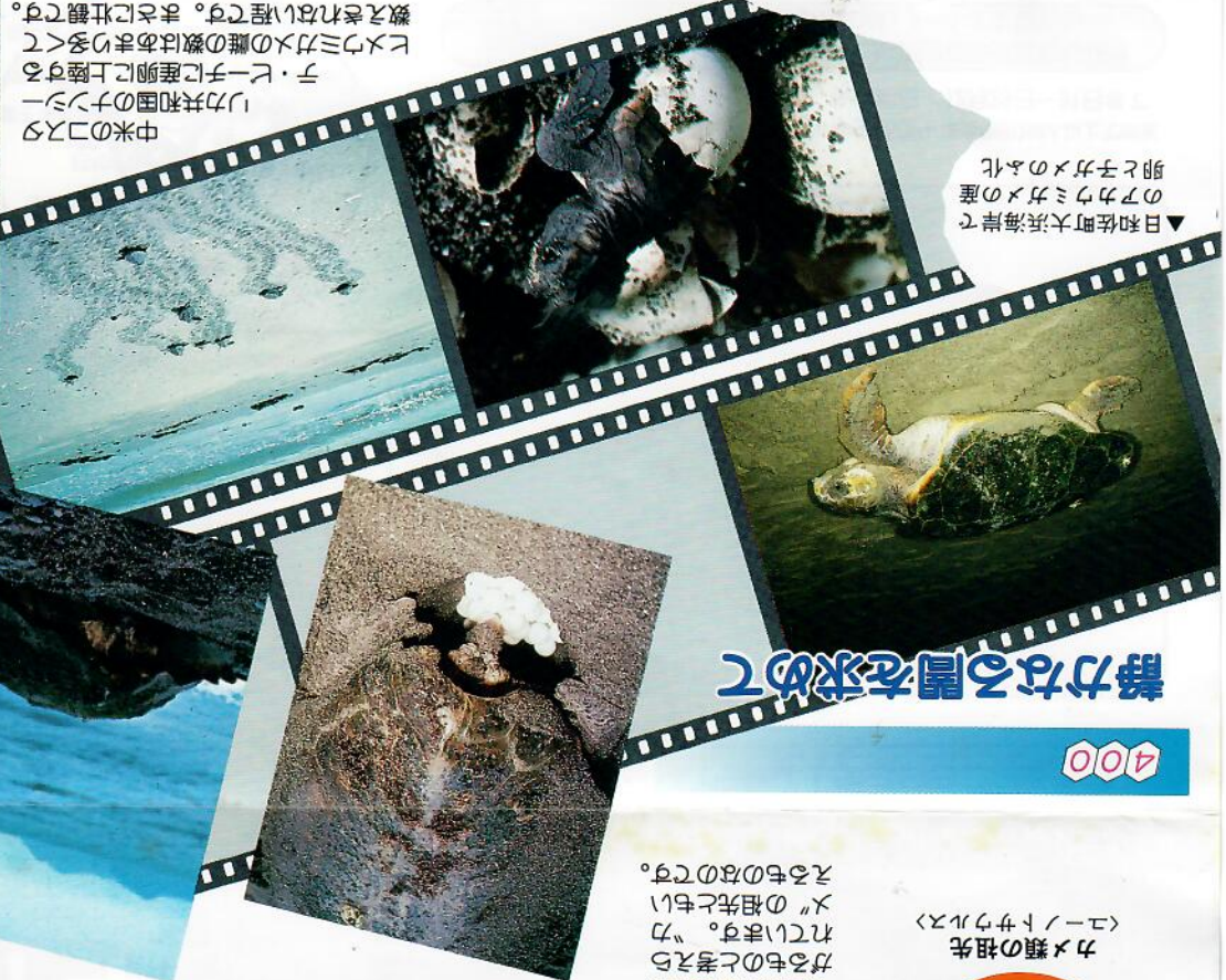
▲日佐町大浜海岸で のアカウミガメの産 卵と子ガメのふ化

中米のコスタ リカ共和国のプン チ・ビーチに産卵に上陸する アカウミガメの雌の数はあまり多くて 数えきれない程です。まさに壮観です。