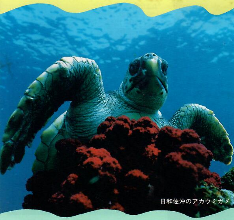
日和佐沖のアカウミガメ