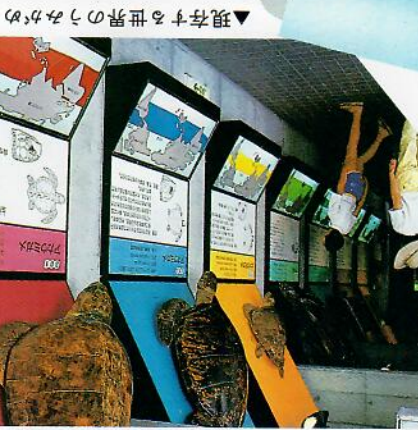
▲現存する世界のうみかめ

カメは現在まで生きている「六つ足」動物の中でもっとも歴史が古いばかりでなく、その形(甲らをもっとも歴史が古い)は2億年前、すでにほとんど完成していました。そして長い間に起った想像を絶する地球の変化や外敵にも耐えてきました。 カメの歴史(約2億年)を1日に置きかえたと人間の歴史(約300万年)は、わずか20分にしかすぎません。