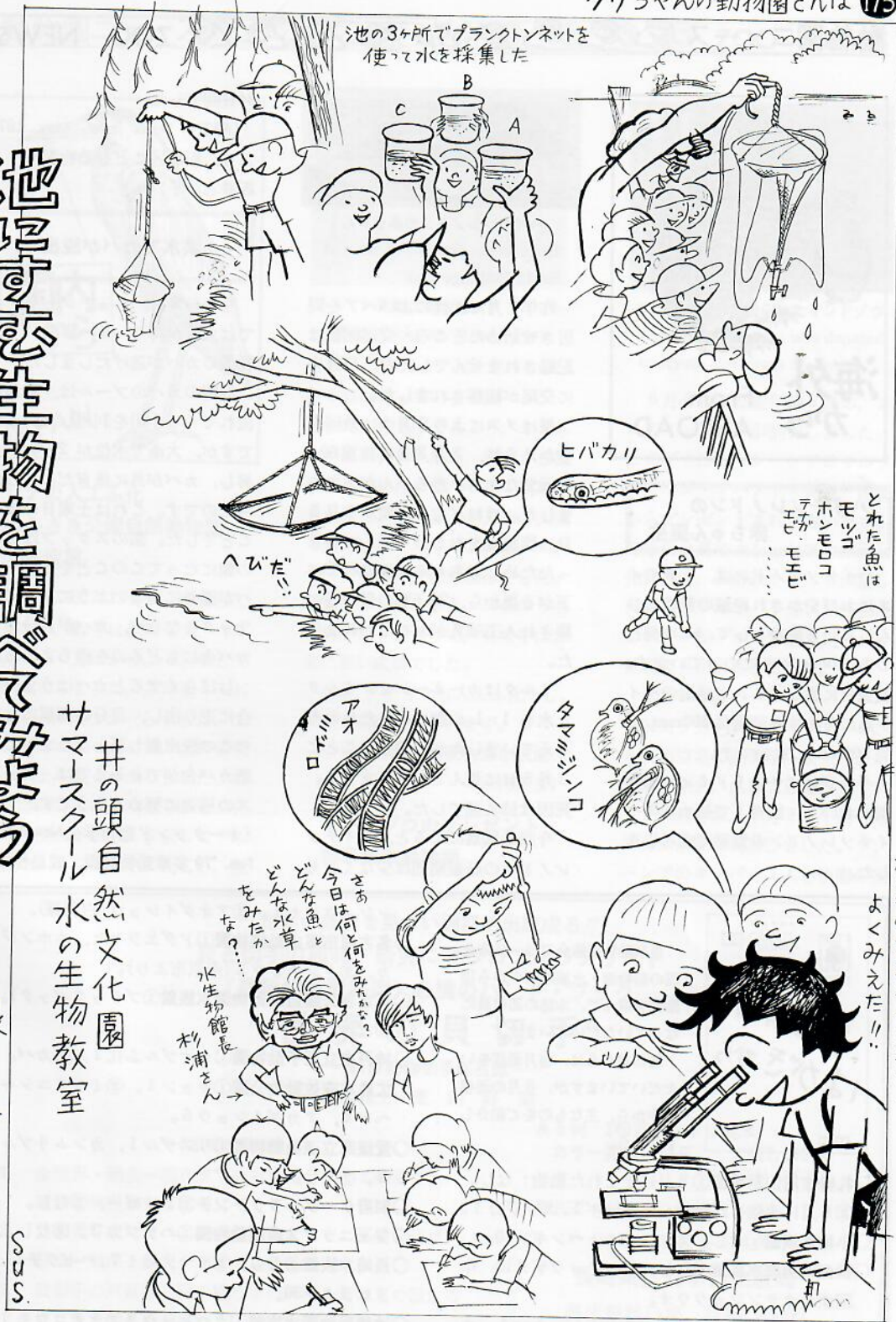
Kuri-chan at the Zoo: Summer school at Inokashira Zoo. by Susumu Nemoto.