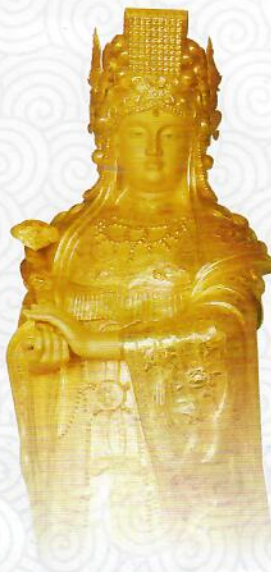
顺济殿内的纯金妈祖圣像