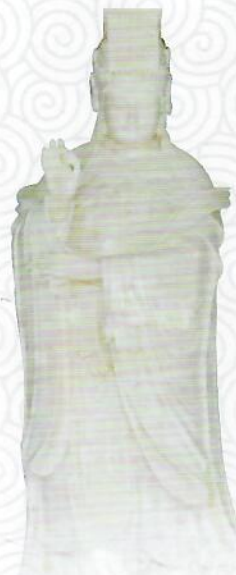
妈祖文化展览馆内的砗磲妈祖圣像