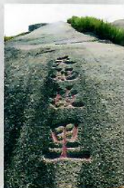
「天妃故里」(明代)石刻