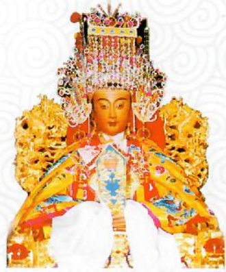
寢殿內的金身媽祖