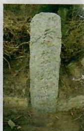
「天妃祖迹地名上林」(明代)碑刻