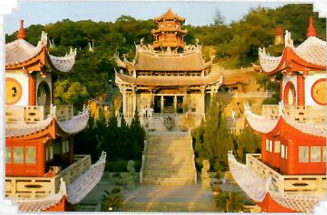
西轴线钟鼓楼及太子殿