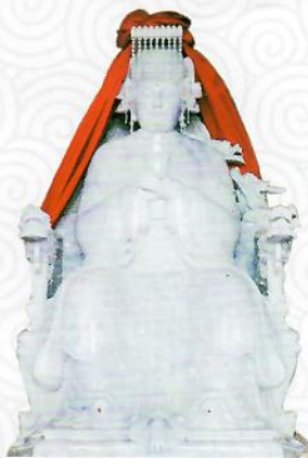
宫门殿内的翡翠妈祖圣像