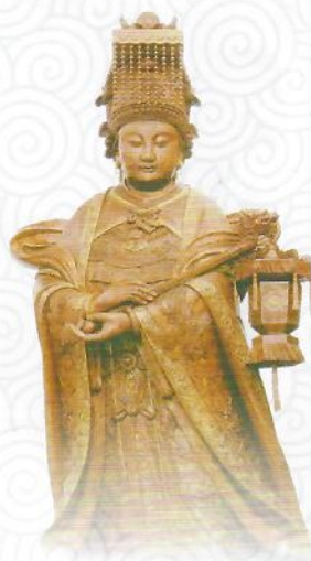
朝天阁内的红木妈祖圣像