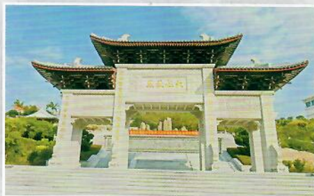
妈祖出生地——天妃故里