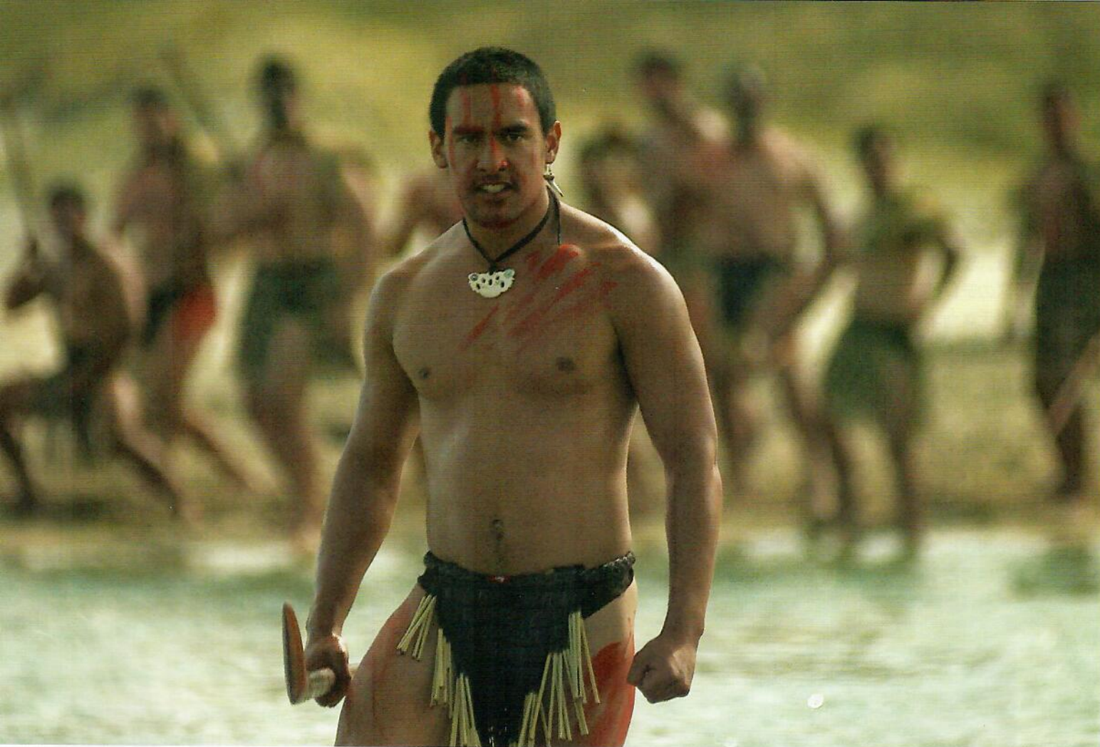
PHOTO EXTRAITE DU DOCUMENTAIRE TUPAIA, PRIX SPÉCIAL DU JURY. / PHOTO FROM THE DOCUMENTARY, TUPAIA, SPECIAL JURY PRIZE.