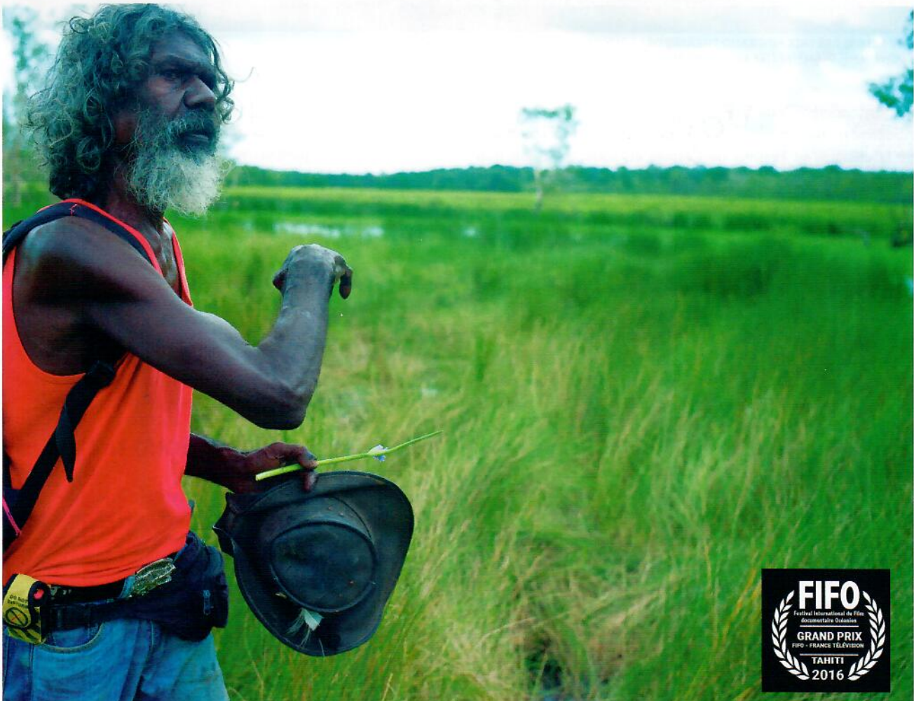
PHOTO EXTRAITE DU DOCUMENTAIRE AUSTRALIEN ANOTHER COUNTRY. /PHOTO FROM THE AUSTRALIAN DOCUMENTARY, ANOTHER COUNTRY.

During this 13th edition, the Australian film Another Country swept the Grand Jury Prize. In this film, Australian Aboriginal actor David Gulpillil recounts what happened when the way of life of his people was interrupted by the "white" ways of living.