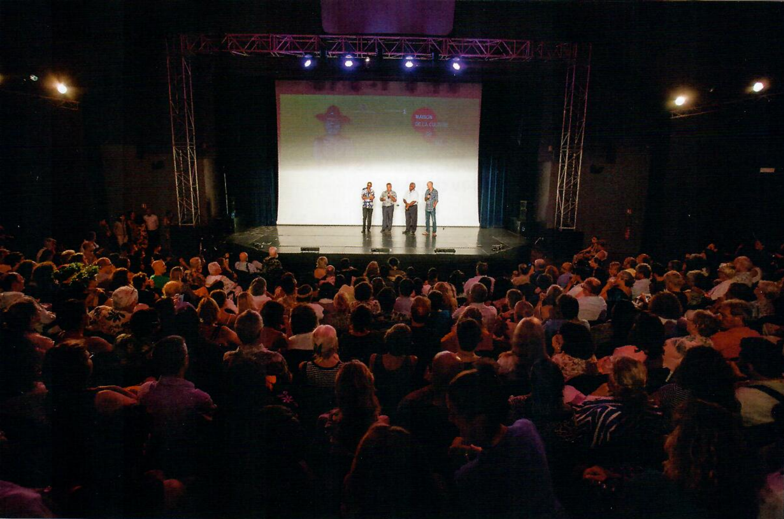
CÉRÉMONIE DE REMISE DES PRIX AU GRAND THÉÂTRE DE LA MAISON DE LA CULTURE DE PAPEETE. AWARDS CEREMONY IN THE GRAND THÉÂTRE AT THE MAISON DE LA CULTURE, PAPEETE.