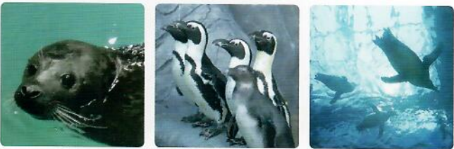
춤추는 물범 / 일2회 | 뒤통뒤통 펭귄 / 일2회 | 플라잉 펭귄 / 일2회