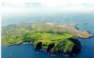
우도 성산항까지 5.6km