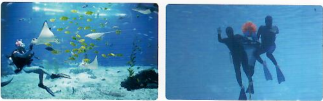
메인 수조 피딩 / 일3회 | 제주 해녀 물질 시연 / 일4회