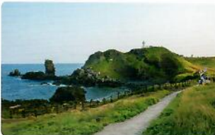
섭지코지 1.5km 도보 30분