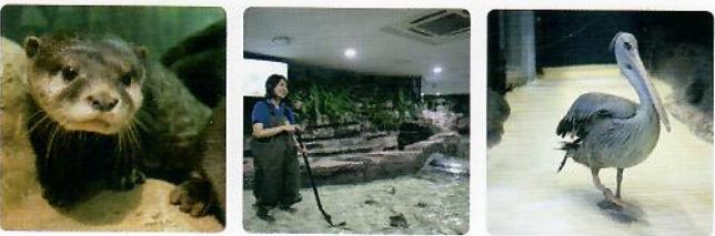
달리는 수달 / 일2회 | 터치풀 / 일2회 | 부리왕 펠리컨 / 일2회