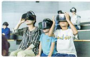
3,600원 제주의 이곳 저곳을 누비는 실사 기반 VR 체험