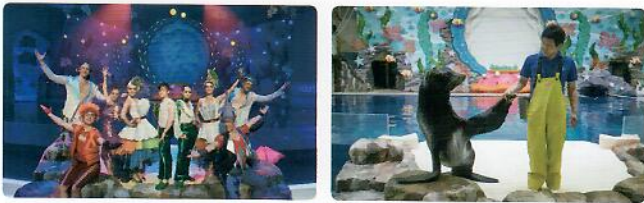
아쿠아 판타지아 다이내믹 오션 뮤지컬 | 아쿠아 스토리 바다사자, 큰돌고래