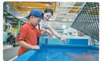
7,000원 초대형 수조 위, 숨겨진 비밀 공간 탐험 생태 체험 및 아쿠아리스트 직업 체험