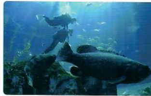
119,000원 할인가 98,000원 세계적 규모의 초대형 수조에서 다양한 생물을 만나는 다이빙 체험