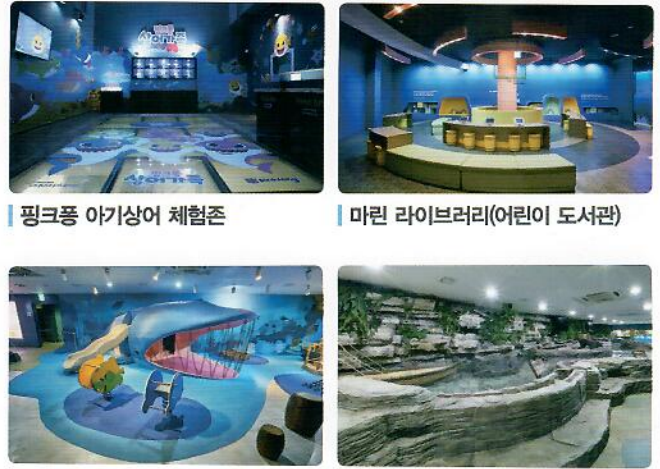
핑크퐁 아기상어 체험존 | 마린 라이브러리(어린이 도서관) 바다 놀이터 | 해양 생물 터치풀