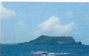
성산일출봉 4.4km 도보 60분