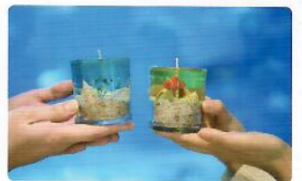
10,000원 - 12,000원 나만의 머그컵, 캔들, 테왁 방향제 만들기 체험