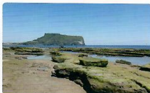
광치기 해변 2.7km 도보 40분