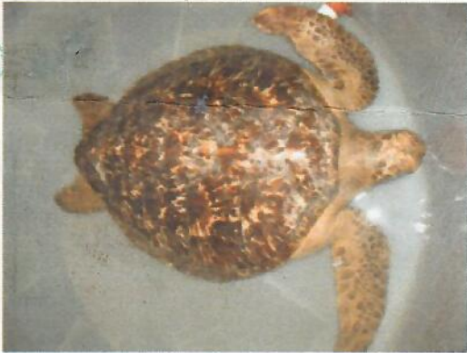
(2) CamaraCIMAD19-2009 1066.jpeg