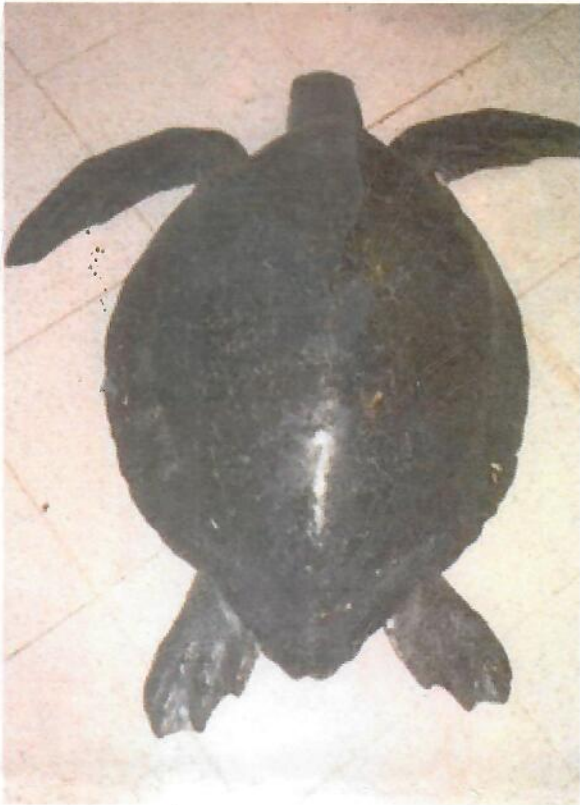
(1) GPC1 = CMP4