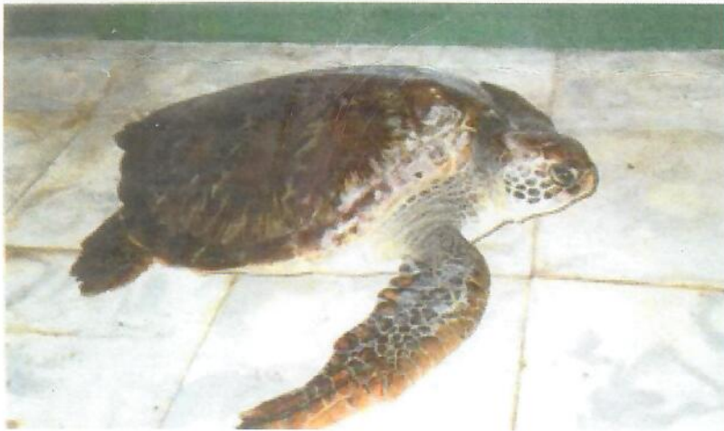
(4) GPC6= CMP21