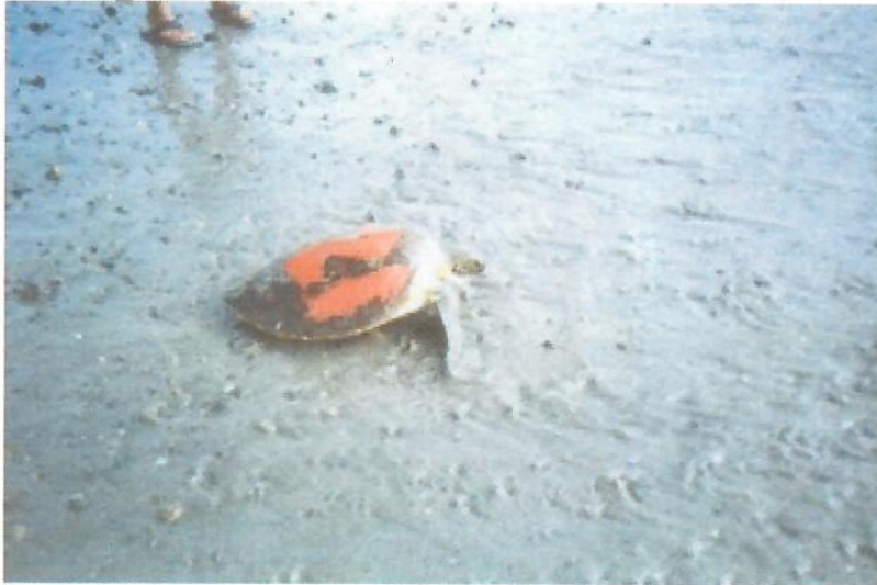
(5) GPC2 = CMP15