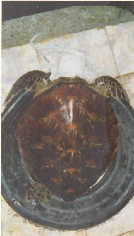
(6) GPC5 = CMP22 [SAME AS #3]