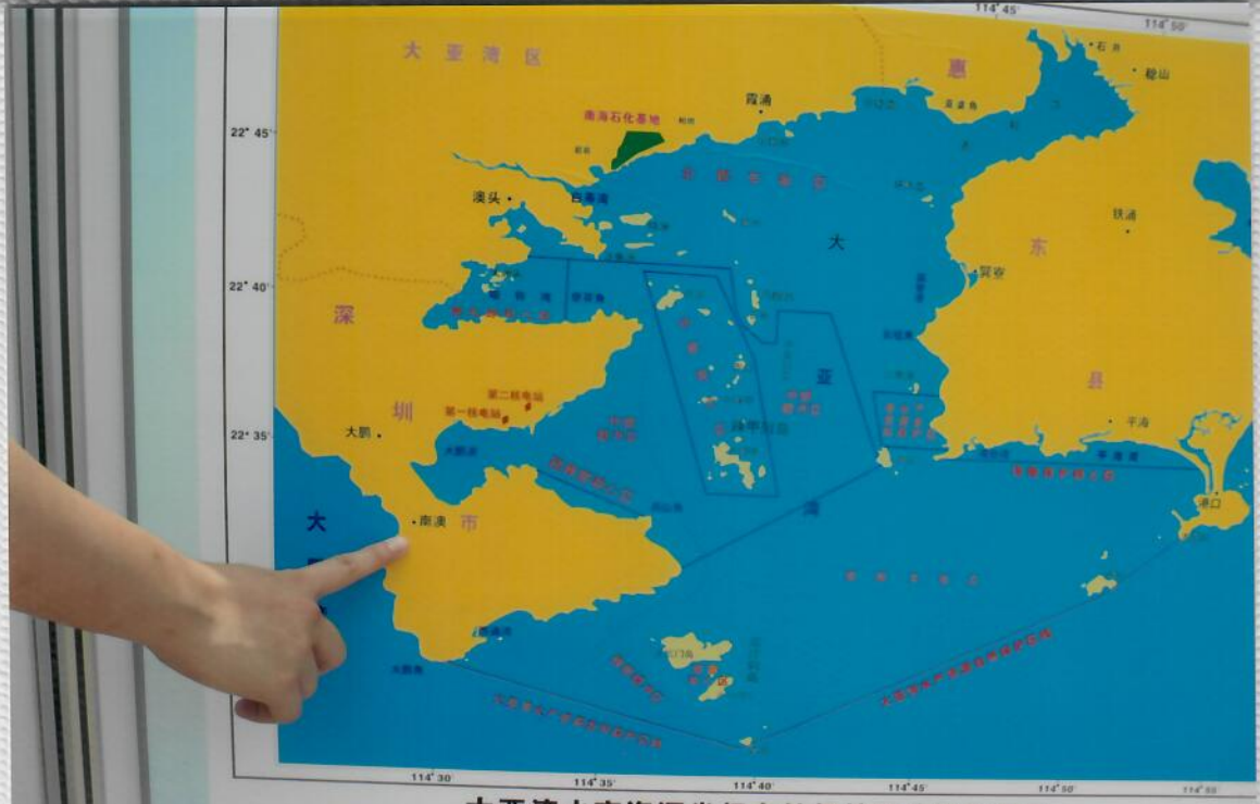
大亚湾水产资源省级自然保护区功能区划图

2010年9月29日，在庆祝中华人民共和国成立61周年之际，广东放生协会组织会员在我国大陆唯一的海龟国家级自然保护区举办以“放生海龟、祈福中华”为主题的放生活动。海龟象征吉祥、长寿、幸福。我们以放生海龟活动为载体，表达全体会员祈愿伟大祖国国泰民安、繁荣昌盛的共同心声。