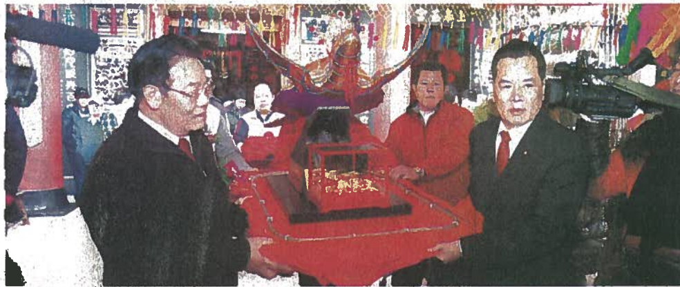
●縣長與去年金龜得主恭送金龜進水。

縣長致詞時祝福鄉親元宵節快樂，他表示，元宵節是澎湖人最重視的民俗節慶之一，山水上帝廟元宵金靈龜更是全台灣知名，非常具特色的慶典活動。縣府除了配合交通管制維護，更於2月14日至16日山水三〇高地施放煙火，歡迎鄉親及旅客共襄盛舉踴躍前往觀賞，歡樂鬧元宵看煙火，體驗元宵民俗慶典氣氛。同時對於廟方推動民俗技藝八音、涼傘等，他也表示縣府會全力支持，並將繼續推動，希望大家爲澎湖民俗技藝的薪傳共同努力。