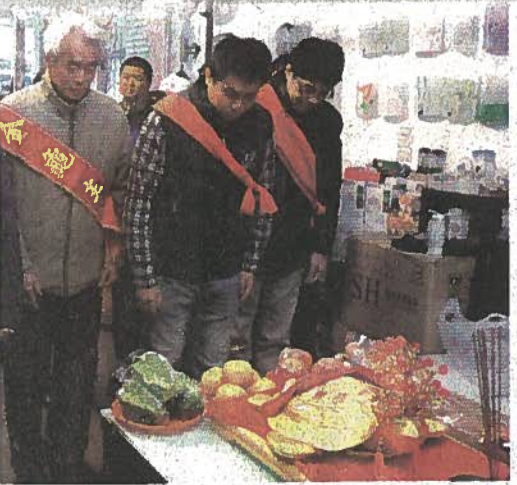
△全澎湖最重鎖港大黃金龜，去年得主祭拜後，由廟方迎回。