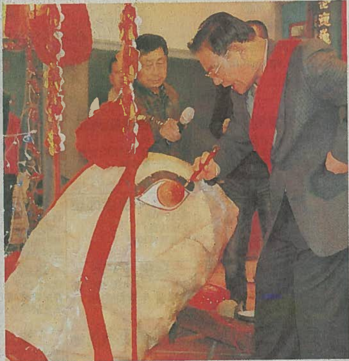
● 王縣長為大米龜開光。