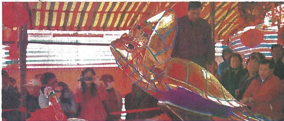
●山水上帝廟金龜一度稱霸全台。（鄒秀成攝）