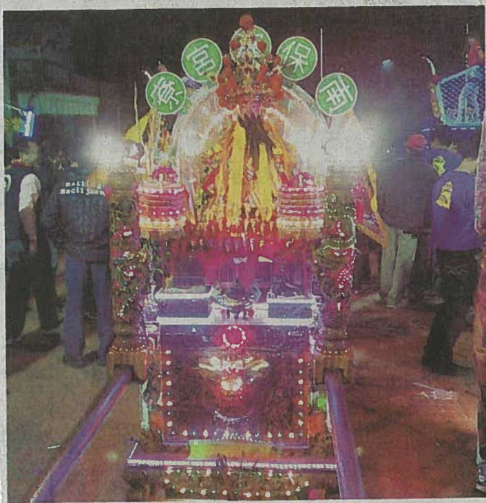
● 湖西南寮社區武轎出巡。